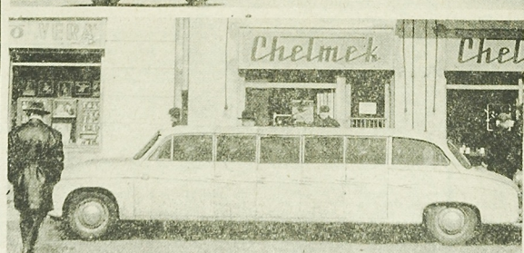
„SYRENA” ZMODERNIZOWANA. Konstruktorzy FSO na Żeraniu opracowali nowy model popularnej „Syreny”, tzw. „Syreny-Max”. Jest to pierwszy model dwuosobowy. Dodatkowym walorem nowego modelu „Syreny” jest to, że może ona także kursować się jak poduszki. Oto jak efektownie wygląda ten samochód nad jeziora.

Proletariatusz wszystkich krajów, łączcie się!