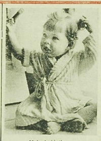
Mala kobieta...

Gdy Cary Granta zapytano, po obejrzeniu przez niego pierwszego filmu o nidydach, co o nim sądzi, znany aktor odpowiedział: — „Przez cały czas zastanawiałem się, gdzie jest ci tu ździe — trzymaj swoje klucze od samochodu! (Ag)