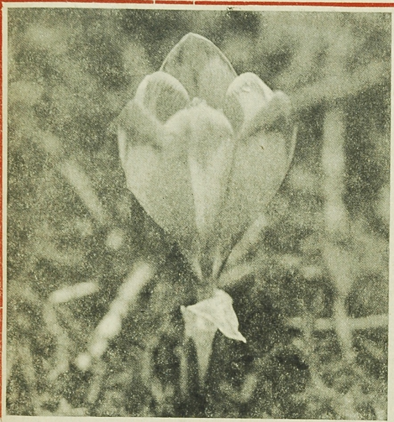
Zakutity krukusy w Zakopanem.